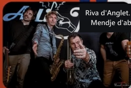
Riva d'Anglet, Tékum Insandi Mendje d'abus yourna de

Plongeons ensemble dans l'histoire de la lenga nosta, parlée dans tout le sud de la France, mais aussi le savez-vous... en Espagne et en Italie !